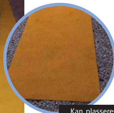
Kan plasseres hvor som helst

Scotgrip® sklisikre FlexTile sørger for en robust, holdbar og sklisikre overflate på arbeidsplassen. Designet for å passe til eksisterende dekk, gangveier eller gulv. Sikkerhet for personell blir godt ivaretatt ved installasjon av Scotgrip® antiskli FlexTile selv under forhold med vann- og oljesøl.